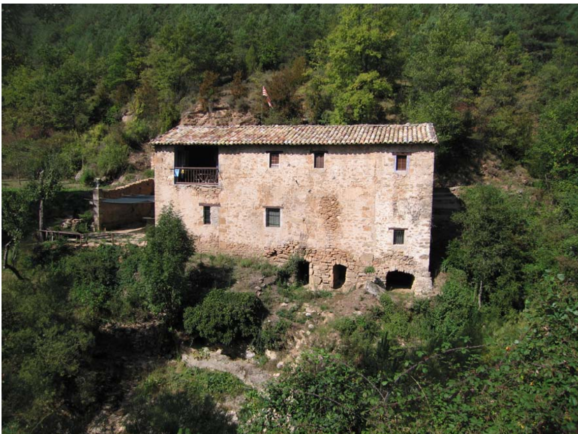
Molí de la Corriu a on es poden veure les eixides dels tres carcabàs