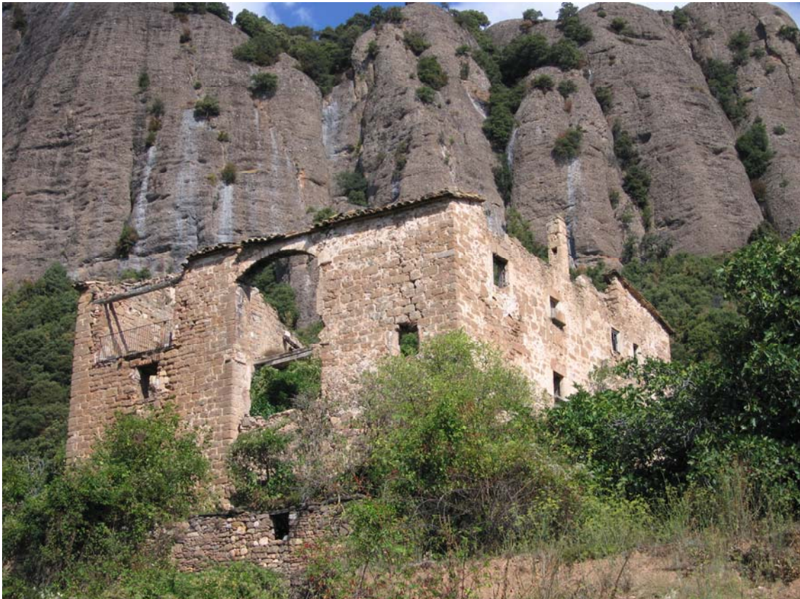
Torre de la Corriu s..XIII i Casa del s.XVIII